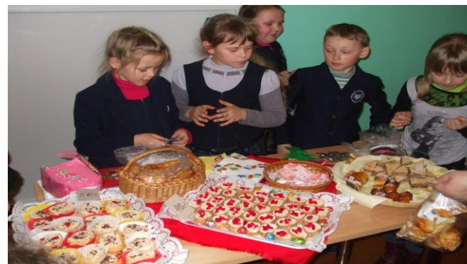
Uczniowie klasy 4

W holu szkoły panował miły, wesoły nastrój. Każdy mógł za symboliczną cenę kupić smaczne pączki, ciasteczka i inne słodycze.