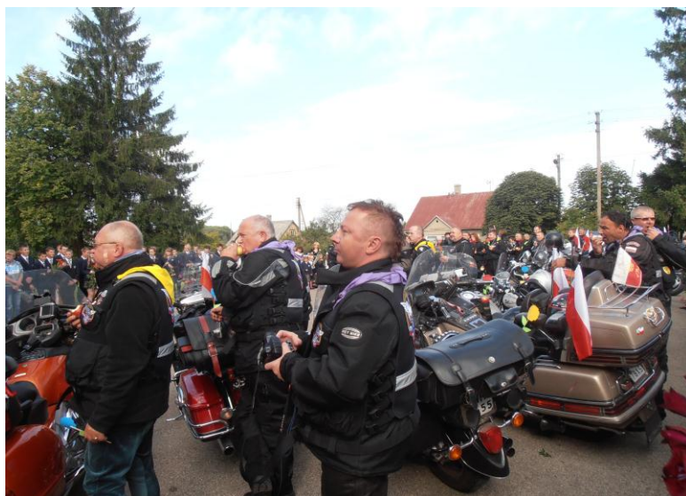
UCZESTNICY RAJDU KATYŃSKIEGU