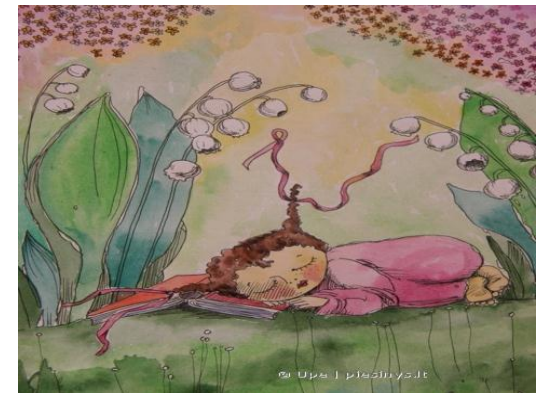
Dorota - Agata Voitkevici 10 kl.