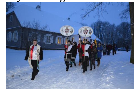
Podbrzezie nad Laudą, gdzie znajduje się jedyne na Litwie Muzeum Powstania 1863-64r