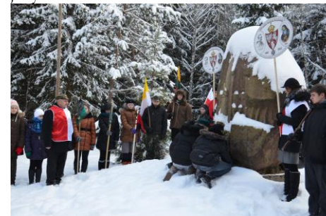
Składamy znicze w miejscu, gdzie niegdyś było obozowisko powstańców.