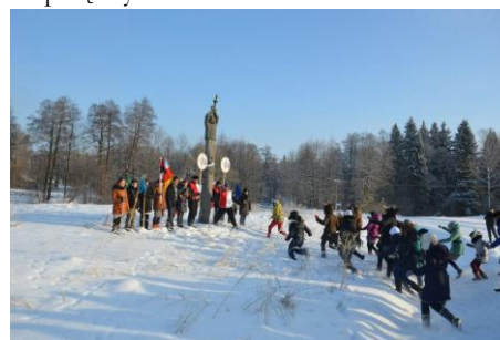
Aura zimowa sprzyja odtworzeniu wizji dawnych bitew z Moskalami.