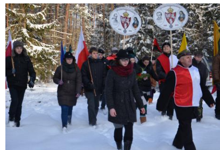
Wiele cmentarzy powstańców znajduje się w potężnych lasach litewskich...