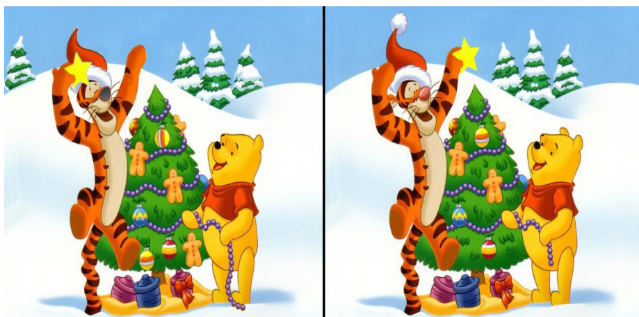
Porównaj rysunki. Zaznacz 10 różnic pomiędzy nimi.

Zespół redakcyjny: Robert Wojczan, Beata Markowska, Agata Sadowska, Dorota-Agata Wojtkiewicz, Renata Rymaszewicz, Rajmund Pawłowicz, Wirginija Sokołowska.